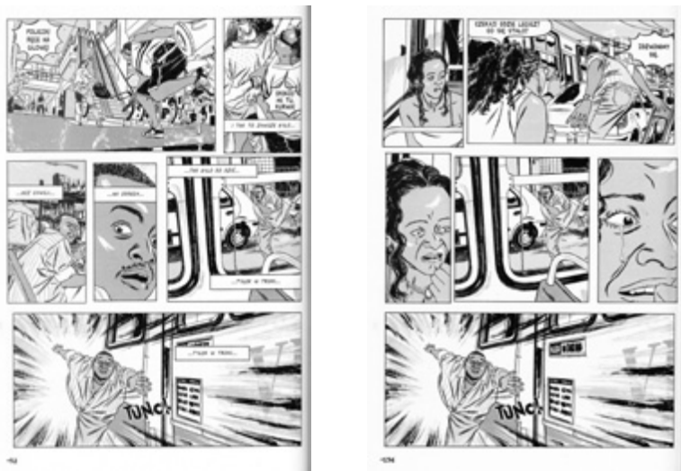
Fig. 1: Uma sequência cortada em Wolfram que se completa parcialmente entre p. 52 e p. 136 (exemplo de funcionamento da network )