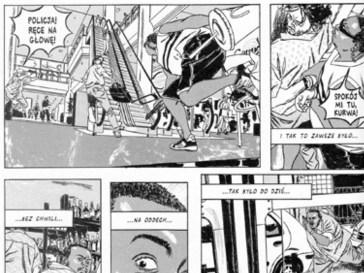
Fig. 3: transição entre vinhetas (de toda a página) em Modlitewnik Narodowy – exemplo de um closure exigente na sequência narrativa